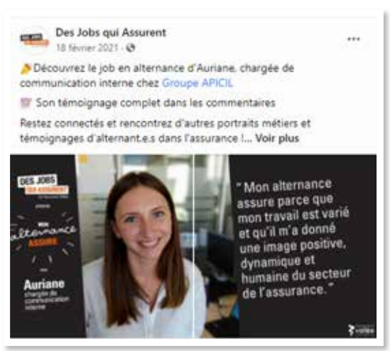
Post témoignage de salariés assurance pour démontrer la richesse des métiers